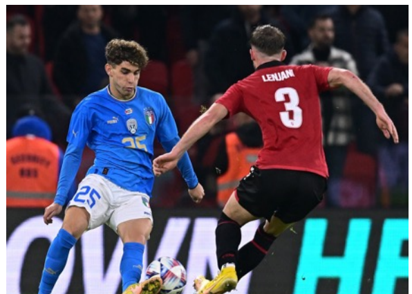
FOTO: Pafundi, all'esordio in Albania, il più giovane dal 1911.

Balotelli, Belotti, Berardi, Bernardeschi, Cancellieri, Caprari, Caputo, Chiesa, Cutrone, El Shaarawy, Giovinco, Gnonto, Grifo, Immobile, Insigne, Joao Pedro, Kean, Lasagna, Okaka, Orsolini, Pafundi, Pavoletti, Pellegrini, Pinamonti, Politano, Raspadori, Retegui, Scamacca, Quagliarella, Verdi, Zaccagni, Zaza, Zerbin.