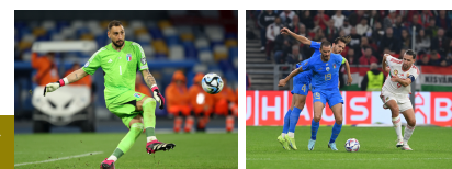
FOTO: Donnarumma, 47 gare per 4.042', Bonucci, 43 gare per 3587'.