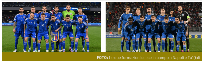
FOTO: Le due formazioni scese in campo a Napoli e Ta' Qali