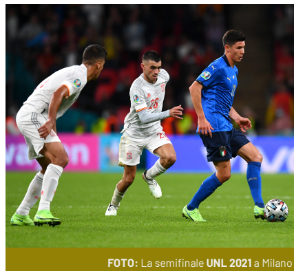
FOTO: La semifinale UNL 2021 a Milano

Sono 39 gli incontri tra Italia e Spagna : 11 le vittorie italiane (l'ultima nel 2016 a St. Denis, 2-0), 16 i pareggi (l'ultimo a Wembley nel 2021, poi Italia avanti ai rigori), 12 le vittorie spagnole, l'ultima a San Siro nella precedente semifinale di Nations League. Il computo delle reti è di 45 a 43. Nel computo dei precedenti in Italia, Azzurri in vantaggio 5/3 con 8 pareggi, negativo invece il saldo in trasferta (7/1 per gli iberici con 3 pari). In campo neutro, tra Olimpiadi, Mondiali e Europei, Italia avanti 5/2, 5 i pareggi che hanno poi in alcuni casi assegnato la vittoria ai rigori (1-2). Sarà il terzo confronto diretto nei Paesi Bassi : i primi due ai Giochi Olimpici '28 a Amsterdam : 1-1 nel primo match, è necessaria la ripetizione, finisce con un 7-1 che è il successo italiano più pesante (il 4-0 in finale Euro 2012 quello spagnolo), famoso anche per il gol di Levratto (2) con un tiro che colpisce due avversari e li trascina in porta insieme al pallone. L'Italia poi avrebbe vinto il bronzo (ko in semifinale con l'Uruguay, poi campione olimpico e, dopo 2 anni, campione del mondo nel primo torneo 1930).