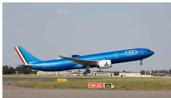
NELLE FOTO. Gli Azzurri durante un trasferimento con aeromobile ITA Airways. Un A330neo in decollo.

LA COMPAGNIA AEREA DI RIFERIMENTO NAZIONALE CONDIVIDE CON LA NAZIONALE IL RUOLO DI AMBASCIATRICE NEL MONDO DELL'ECCELLENZA ITALIANA