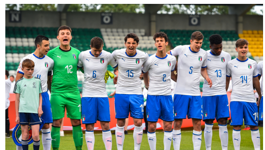
Euro U17 del 2019: l'ITALIA in semifinale con la Francia

Note: ammoniti 42' Cudrig, 43' Panada, 56' Dalle Mura, 79' Raatsie, 90' Hoever, 94' Unuvar