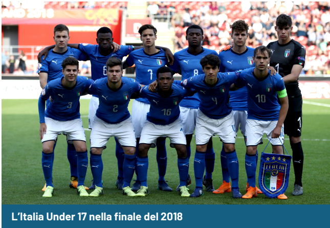
L'Italia Under 17 nella finale del 2018