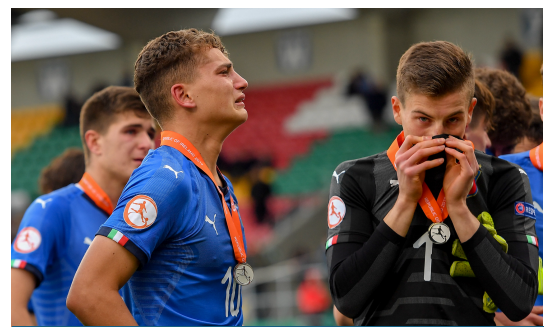
Euro U17 del 2019: le lacrime degli Azzurrini