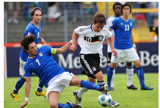
Euro U17 2009: Sini contrasta un giovane Mario GOTZE

NOTE: spettatori 2.000 circa. Ammoniti Agazzone, Thompson. Angoli 4-2 per l'Eire. Un minuto di silenzio in ricordo delle vittime del disastro in Campania.