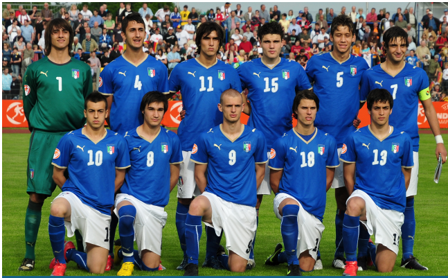
La Nazionale Under 17 che nel 2009 ha chiuso al 3° posto, con la qualificazione al Mondiale in Nigeria.