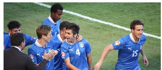
Euro U17 2013: gli Azzurrini esultano dopo il successo sulla Slovacchia in semifinale.