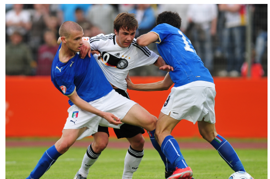
Euro U17 2009: ancora Mario GOTZE in azione.